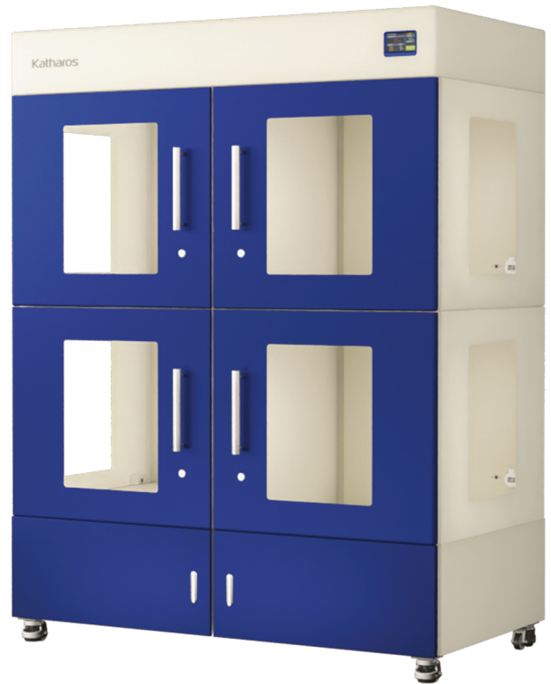
ZEO-PUH154 / ZEO-SPH154