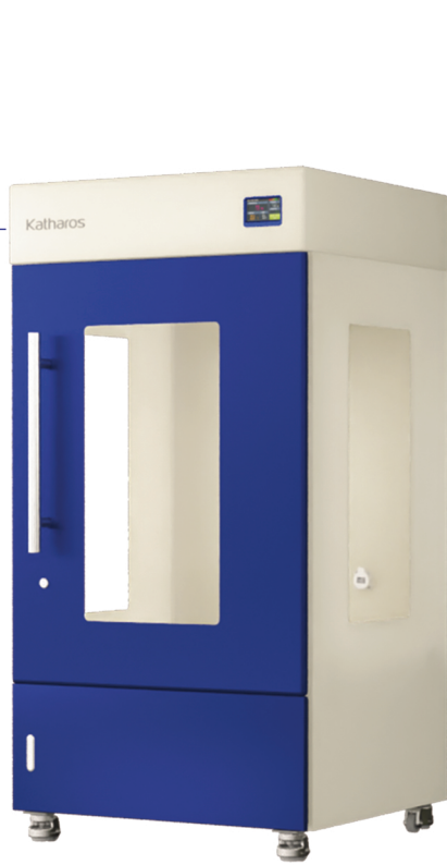
ZEO-PUH151L / ZEO-SPH151L