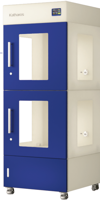
ZEO-PUH152 / ZEO-SPH152