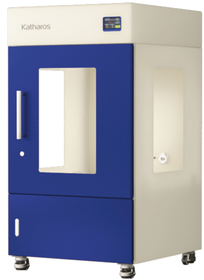
ZEO-PUH151 / ZEO-SPH151