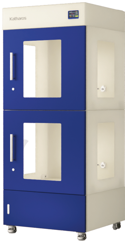
ZEO-PUH152L / ZEO-SPH152L